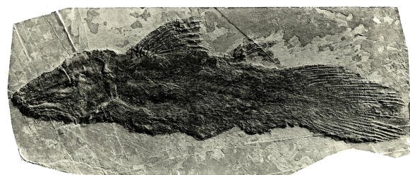
Heptanema paradoxum da Perledo, Lago di Como. (Da Giulio de Alessandri 1910)