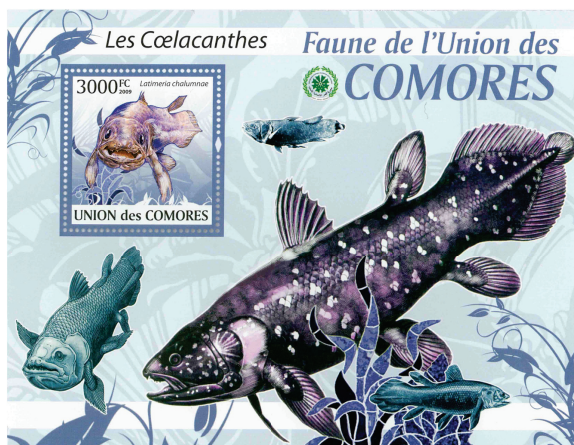
Latimeria chalumnae , francobollo dell'Unione delle Comore. (Rudolf Stockar)

Una seconda specie di Latimeria apparve il 18 settembre 1997, in modo altrettanto fortuito: al mercato del pesce di Manado sull'isola indonesiana di Sulawesi, fu notata da una coppia in-