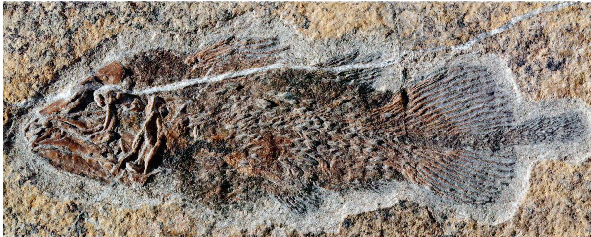
Il nuovo fossile di celacanto scoperto sul Monte San Giorgio: è il primo dal Calcare di Meride e appartiene al genere Heptanema .

Il capitano, il grosso pesce, la curatrice del museo, il professore... quella che sembra la trama di un romanzo è la storia della scoperta del primo esemplare vivente di celacanto, un pesce appartenente a un gruppo noto ai paleontologi come fossile ma dato per estinto da 70 milioni di anni. E non uno qua-