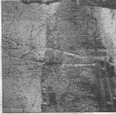
Una guardia ecologica del Parco c

to ricordare la nascita del Parco Regionale Campo dei Fiori, nato nel marzo 1984. Quest'anno sarà la quarta volta di "Vie del Parco", progetto organizzato dall'Ente e da Uisp, Unione italiana sport popolari: oltre a tutte le manifestazioni delle singole Pro Loco e delle diverse Associazioni sul territorio, verranno promosse giornate d'incontro, denominate "Verdazzarò", con diverse discipline sportive attraverso la prova gratuita o semi-gratuita di sport inusuali, come il torrentismo o canyoning, l'arrampicata sportiva, la vela, l'equitazione. Ma nel calendario troviamo anche iniziative culturali, gastronomiche, musicali che si concluderanno solo a settembre, cioè il mese in cui sono previste le celebrazioni per il ventennale del Parco. Le informazioni presso la sede dell'Ente, in via Trieste 40, tel. 0332-435386.